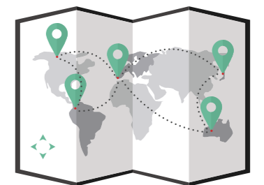
유통/고객관리 서비스 DISTRIBUTION/ CUSTOMER MANAGEMENT