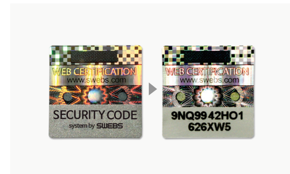
인증코드 (PIN) 입력방식 INPUT PIN

SWEBS is perfect system to protect your valuable customers and brand from illegal fake items.