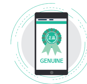
정품인증 서비스 GENUINE CERTIFICATION