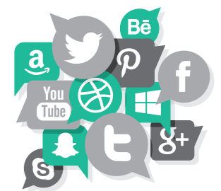
SNS 마케팅 SNS MARKETING