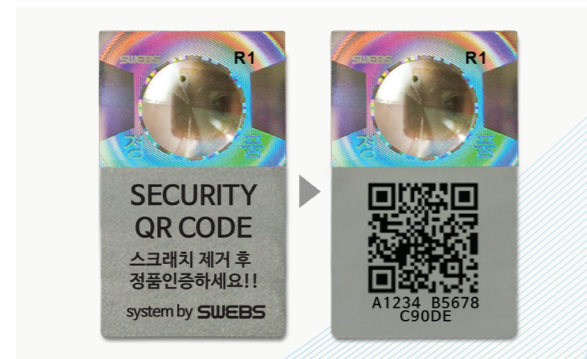
QR 코드 스캔방식 SCAN QR CODE

귀사의 브랜드 보호 및 위조방지를 위해 최적의 보안솔루션을 제공하여 드리겠습니다.