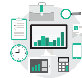
마케팅 정보 제공 PROVIDE MARKETING DATA