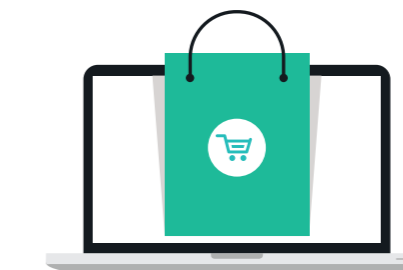
컨텐츠 페이지 제공 PROVIDE VARIOUS CONTENTS